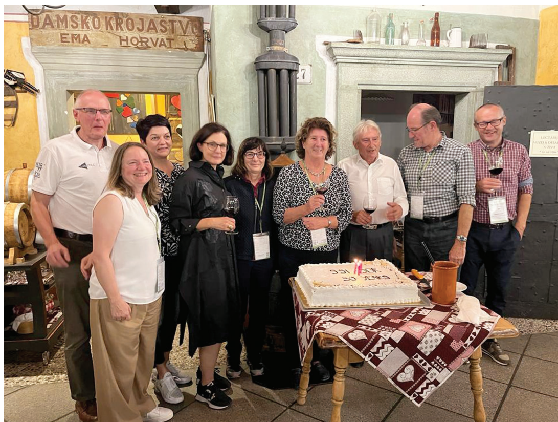
Slika 3: 30 let SDI-SOR (predstavniki EURO in SDI-SOR, 20. september 2023, konferenca SOR'23 na Bledu, Slovenija).

-SOR in HDOI organizirata mednarodni simpozij OR, in sicer, eno leto v Sloveniji, drugo leto na Hrvaškem. Tako je SDI-SOR organizirala SOR'93, SOR'94, SOR'95, SOR'97, SOR'99, SOR'01, SOR'03, SOR'05, SOR'07, SOR'09, SOR'11, SOR'13, SOR'15, SOR'17, SOR'19, SOR'21 in SOR'23. Prispevki, predstavljeni na teh simpozijih, so bili recenzirani in objavljeni v zbornikih posameznih simpozijev (Proceedings of the ... (2023), (2021), (2019) ... (1993)). Zborniki so na voljo tudi v elektronski obliki na naslovu https://www.drustvo-informatika.si/sekcije-drustva?stran=publikacije-sor , do katerega lahko dostopate tudi s spletne strani simpozijev https://sorf.fov.um.si/publications/ . Podrobna poročila o simpozijih so na voljo na spletni strani https://www.drustvo-informatika.si/sekcije-drustva .