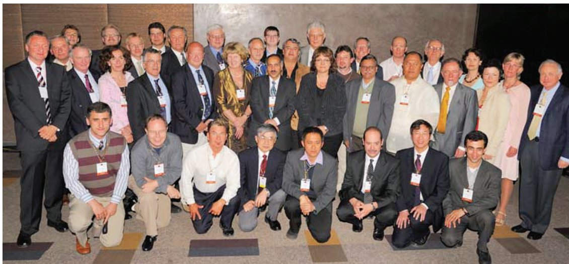
Slika 1: Predstavniki držav IFORS, ki so prejele certifikat IFORS (julij 2008, konferenca IFORS v Sandtonu, Južna Afrika).

Pomembno vlogo pri razvoju OR imajo nacionalna društva. Leta 1952 je bilo v ZDA ustanovljeno društvo OR Society of America – ORSA, ki je znano predvsem po eni izmed prvih revij na področju OR, Operations Research Journal. Leta 1953 so v ZDA ustanovili inštitut za upravljanje, The Institute of Management Sciences – TIMS. Leta 1995 sta se ORSA in TIMS združila v INFORMS – The Institute For Operations Research and Management Science, https://www.informs.org/ . V INFORMS so včlanjeni tudi OR raziskovalci iz Slovenije, nekateri sodelujejo na INFORMS mednarodnih konferencah, ki jih INFORMS organizira dvakrat letno in kot avtorji člankov pri številnih OR revijah, ki jih izdaja INFORMS, na primer OR/MS Today, Mathematics of OR, Management Science, Decision Analysis, INFORMS Journal on Computing, Interfaces in številne druge. Leta 1953 je bilo ustanovljeno društvo OR tudi v Veliki Britaniji (Operational Research Society – ORS). Sledila so številna druga združenja, kot: ALIO (OR društvo držav Latinske in Južne Amerike, http://www.alio-online.org ), APORS (OR društvo azijsko-pacifiških držav, www.apors.org ) in NORAM (OR društvo Severne Amerike, ZDA in Kanade, https://uia.org/s/or/en/1100037200 ). Nadalje sta razvoj metod OR, kot tudi njihova vse večja uporaba na skoraj vseh podro-