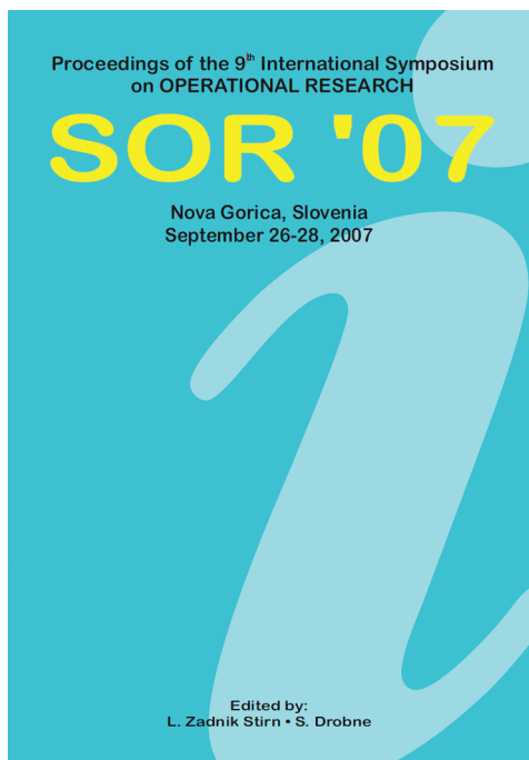
Slika 4: Primer izvoda Proceedings SOR'07 z naslovnico in prvo stranjo vsebine