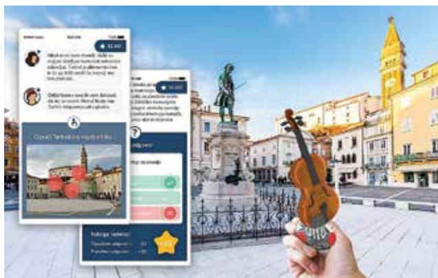
Slika 5: Reševanje izzivov v mobilni aplikaciji Nexto ( http://proxima.si/sl/project/nexto , pridobljeno 12. 2. 2021)

Inovativna in sodobna učna okolja podprta z uporabo različnih informacijsko-komunikacijskih orodij učencem omogočajo poglobljeno usvajanje učne snovi in jim pomagajo pri doseganju višjih oblik učenja ter povezovanja znanja. Učenci so pri učenju motivirani, osredotočeni in željni sprejemati nova znanja. Prožne oblike učenja in inovativna učna okolja podprta z informacijsko-komunikacijsko tehnologijo podpirajo razvijanje ključnih kompetenc 21. stoletja, in sicer učenje, poučevanje, vrednotenje, vsebino, kurikulum, organizacijo, vodenje in vrednote. Za ustvarjanje spodbudnih učnih okolij potrebujemo multidisciplinarni pristop, ki predstavlja enega izmed pomembnih izzivov sodobne in inovativne šole. Za uresničevanje sodobnih konceptov znanja je potrebno zagotoviti vzgojno-izobraževalni načrt, ki je usmerjen na učen-